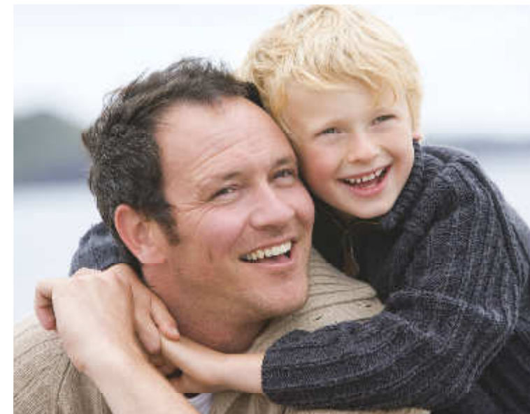
Bildrechte: Fotolia 775G, Monkey Business | Gestaltung: formatplus.net

für verantwortungsvolle Eltern in Trennung / Scheidung